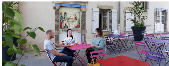
Café éphémère sur le parvis du musée