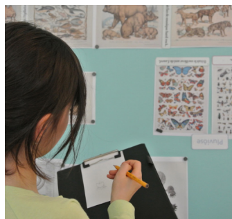
Des jeux en autonomie pour toute la famille.

Ces offres sont accessibles sur présentation du billet d'entrée (sans supplément). Pour des raisons sanitaires, le petit matériel d'activité est à apporter pas vos soins (bloc-note, crayon, écouteurs)