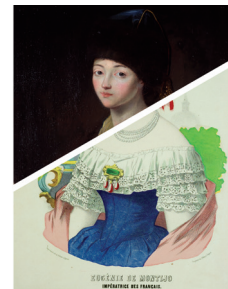
Visuel du Chemin des Images 2020

Un événement national à retrouver à la rentrée. Plus d'informations à venir sur museedelimage.fr